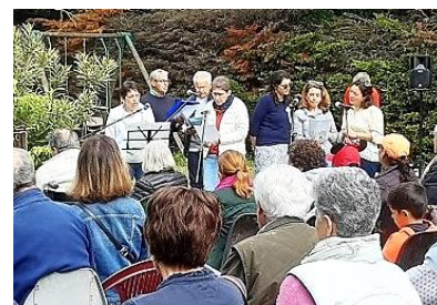
Petite chorale improvisée pour la fête