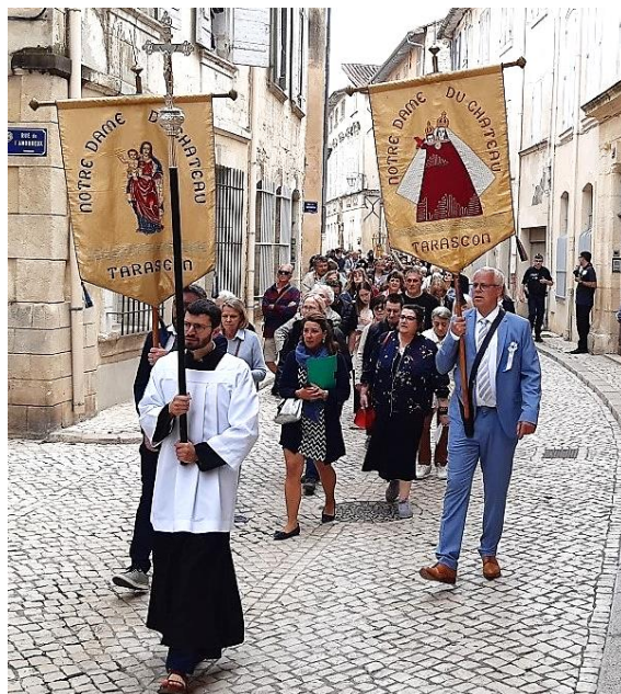
Arrivée sur la place de l'hôtel de ville de Tarascon

Départ de la Procession, du portail Saint Jean, sous le regard attendri de la très belle statue de la Sainte Vierge Marie.