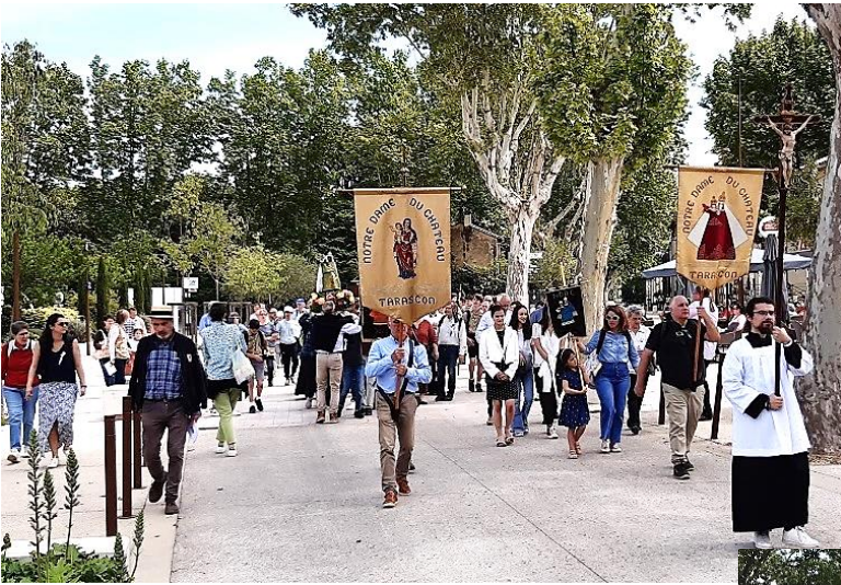
Arrêts en prières et louanges.