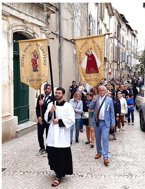
Entrée de la procession dans la collégiale Sainte Marthe.