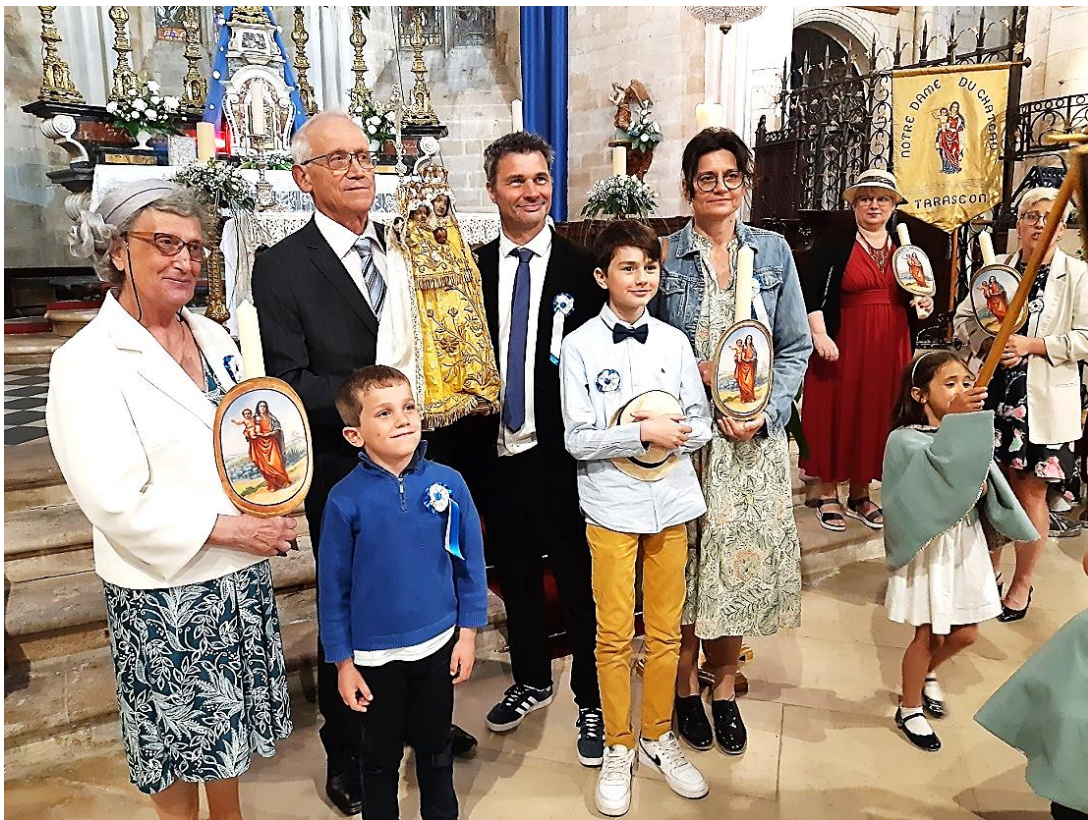
Petite photo du jour avec les prieres et les épouses de cette belle année 2024.

Pour terminer dans la joie cette sainte et magnifique journée, tous les participants ont partagés un copieux et sympathique verre de l'amitié à la maison paroissiale « Béthanie ».